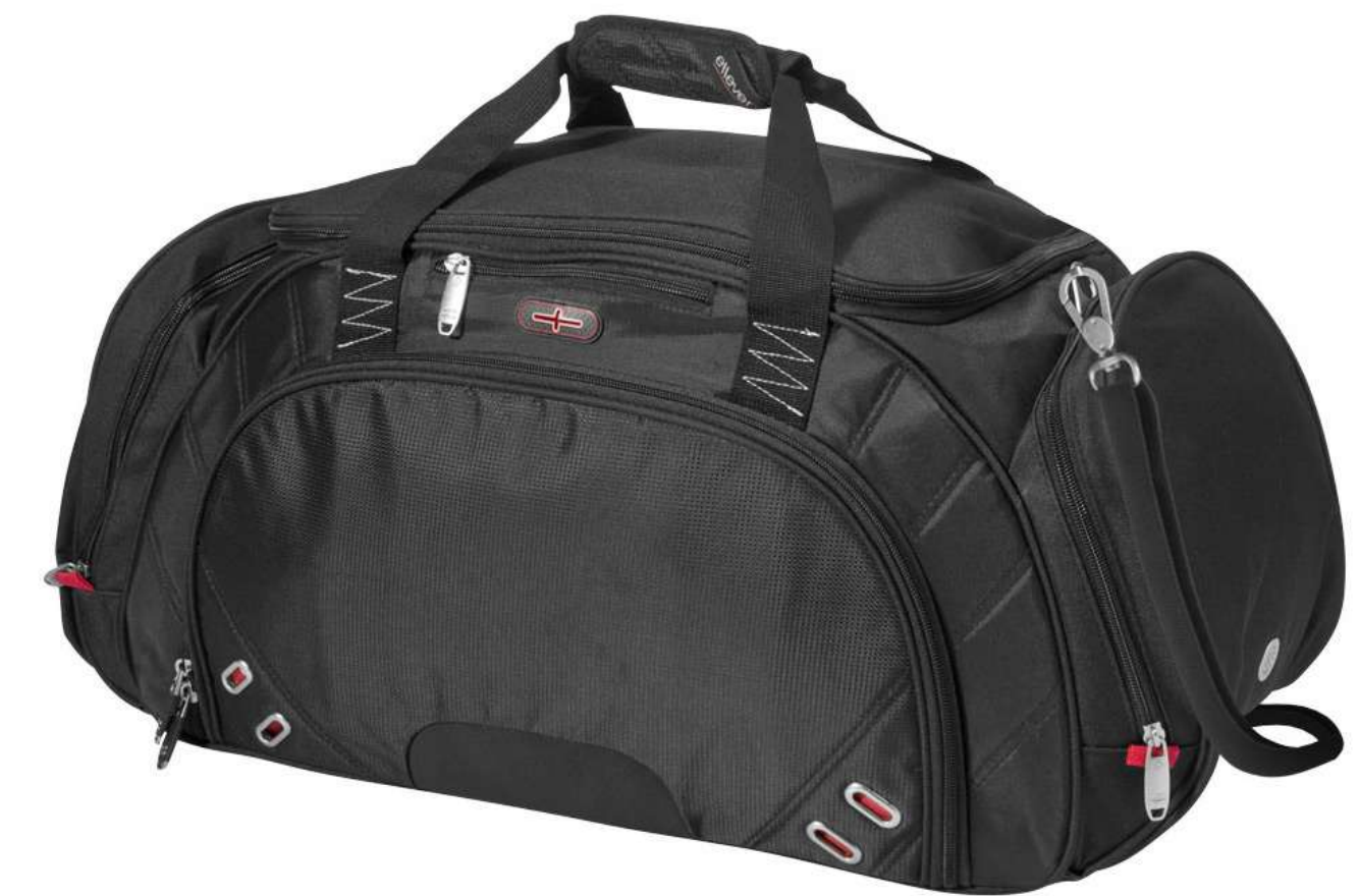
арт. 11988400 Дорожная сумка «Proton»