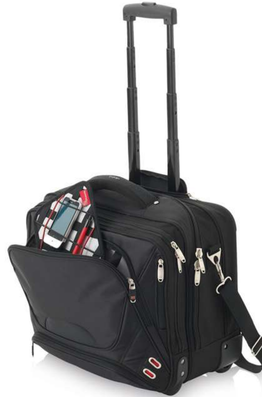
арт. 11964900 Чемодан на колесиках