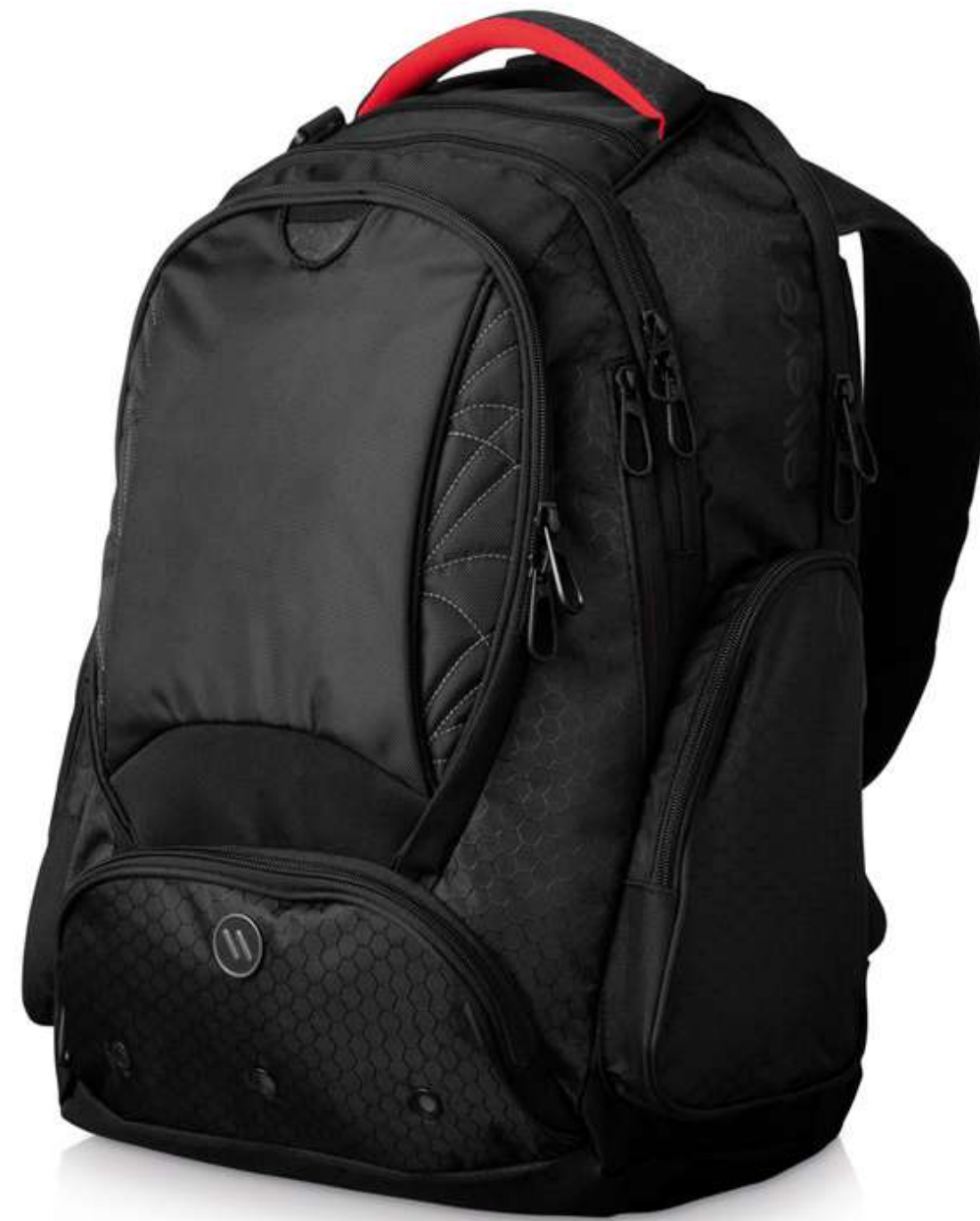
арт. 11988500 Рюкзак «Vapor»