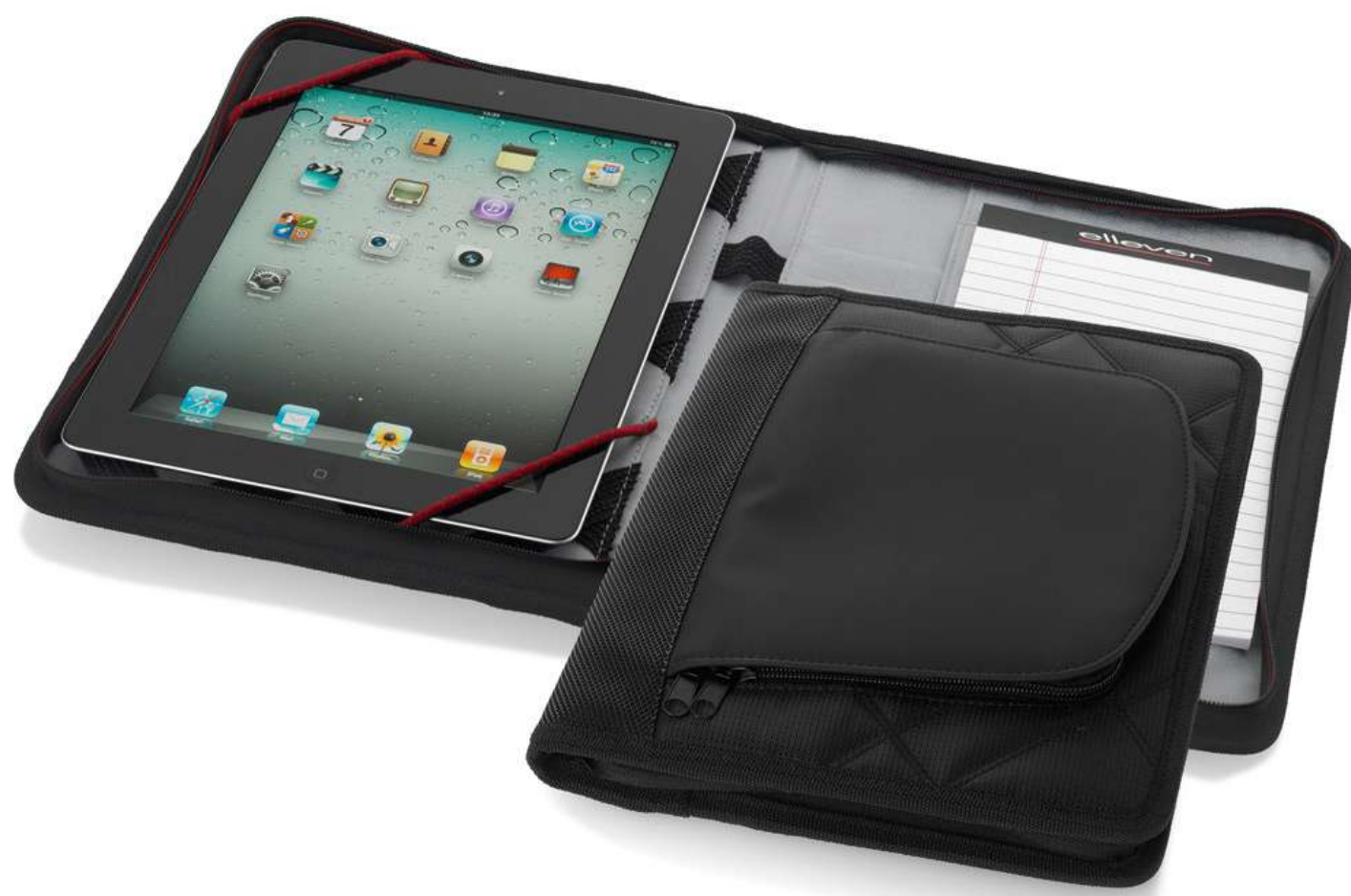
арт. 11954700 Чехол для iPad «Haley»